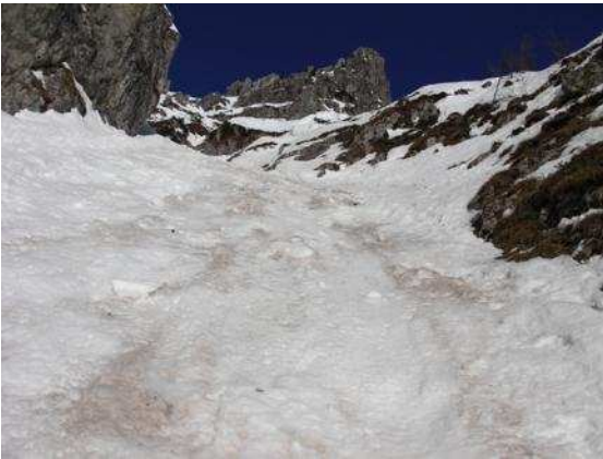
Canale al sole