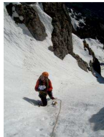
Si controlla il percorso