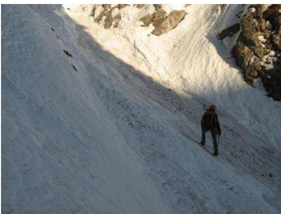
Inizio l'altro Albì