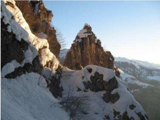
Arriva il sole