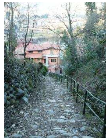
Discesa sul ponte vecchio