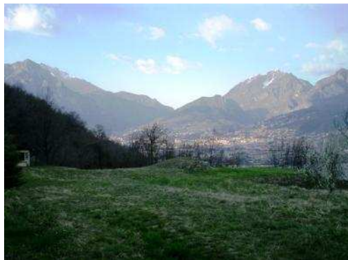
Strada per pian Sciresa